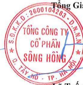
Lã Tuấn Hưng