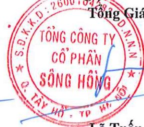
Lã Tuấn Hưng