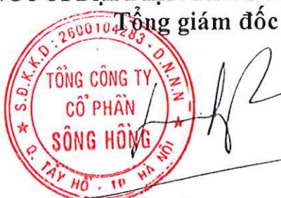
Lã Tuấn Hưng