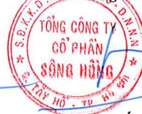
Lã Tuấn Hưng