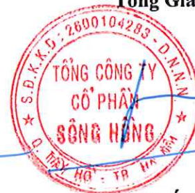
Lã Tuấn Hưng