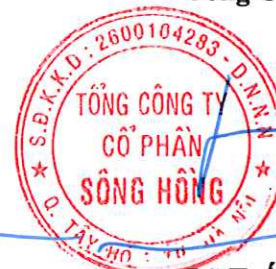
Lã Tuấn Hưng